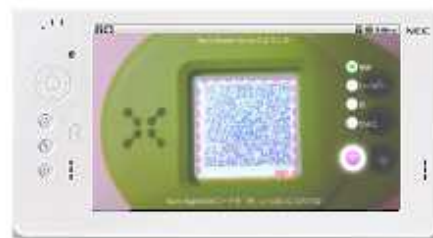
⑤QRコードを読み取ってデータ送信