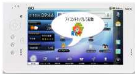
④タブレット端末の専用アプリを起動