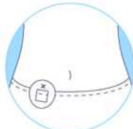
②2つの温度センサが10分間隔で6時間自動計測