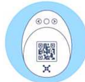
③計測温度データはQRコードで表示