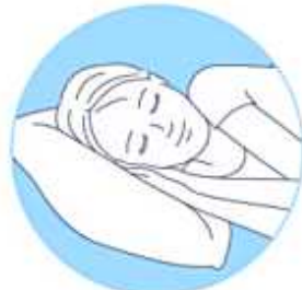
①パジャマかショーツのウエストに挟んで就寝