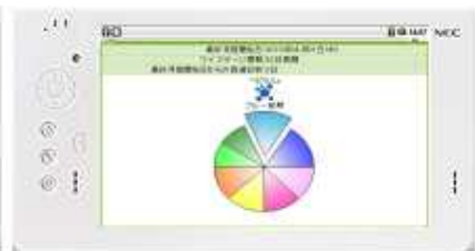
月経周期のステージ etc.